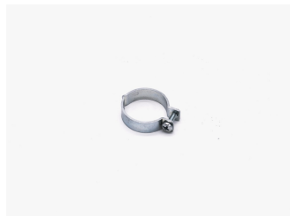
Fascetta Zincata Monovite MEC90